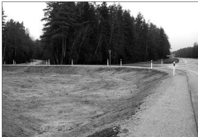
Uuendatud Haimre ristmik on sõitjate arvates kitsas.