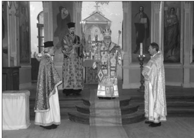
Velise kiriku 125 aastapäeva puhul toimus piiskoplik jumalateenistus, kus teenis ka õigeuskirikliku peavaimulik eestis metropoliit Stefanus.