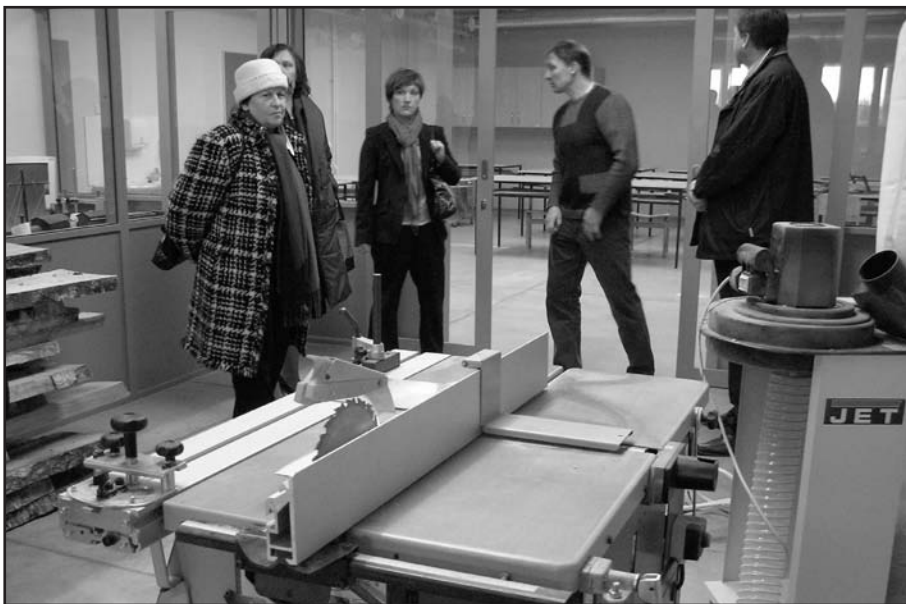
Eesti Linnade Liidu büroo esindus uudistab Märjamaa gümnaasiumi töö- ja tehnoloogiaõpetuse klassi.

Ühise vestlusringi järel toimusid mõtlevahetused neljas töögrupis, misjärel vaadati üle mõned objektid. Luhtre turismitalu oskas oma kiiret arengut meeldejäävalt esitleda. Märjamaa gümnaasiumi