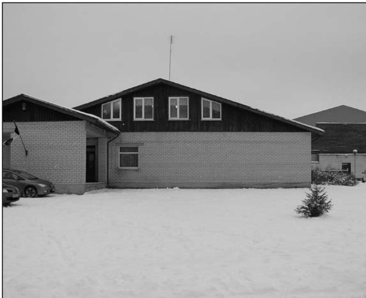
Selle nurga alt paistab Varbola kooli võimla (paremal) ja hoone teised osad.