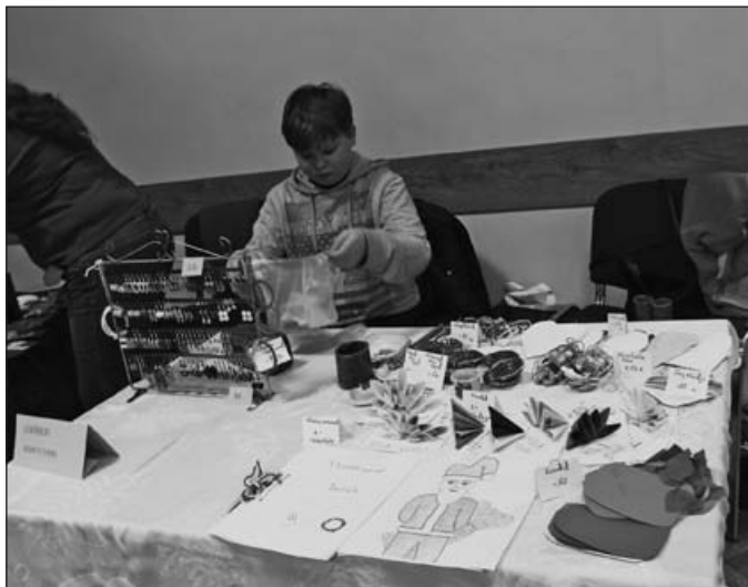
Varbola noortetoa väljapanek kohalikul jõululaadal.