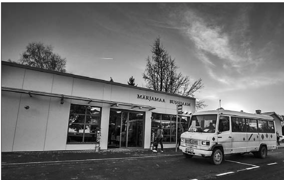
Märjamaa bussijaam on alates 13. detsembrist 2013 reisijatele avatud.

Udo Knaps, Märjamaa bussijuht aastast 1965