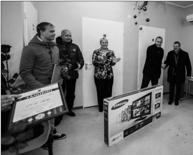
Rapla maavalitsus kinkis bussijaamale elektroonilise tablo.

Ka möödasoitjale on selge, mis hoone see valgusküllane lükkanduste ja rõõmsate kollaste toolidega väike majake on – vastuse annavad seinale kinnitatud