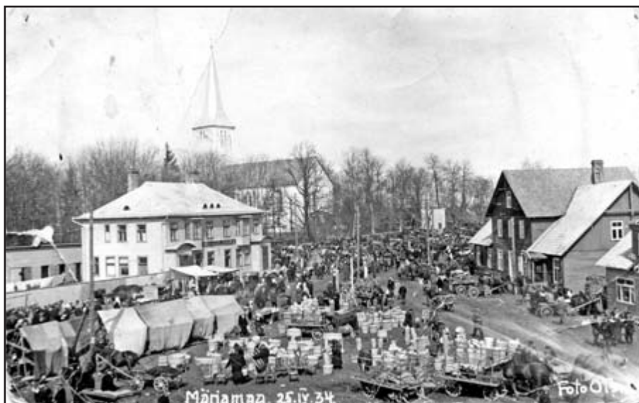
Märjamaa laat 1934. aastal.