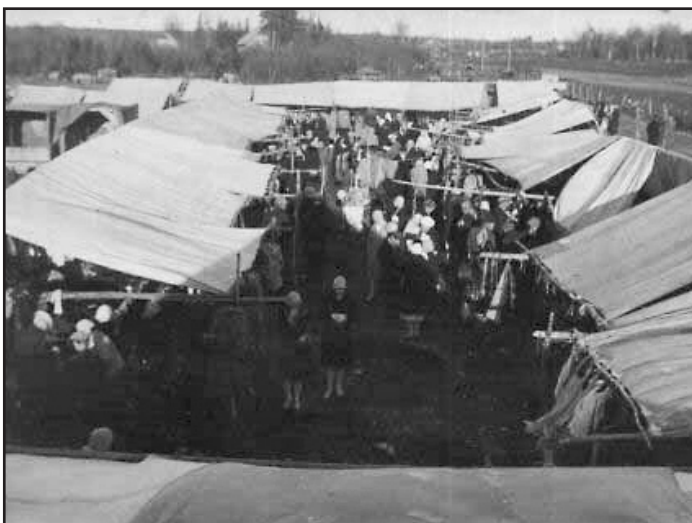
Endisaegne Velise laata.