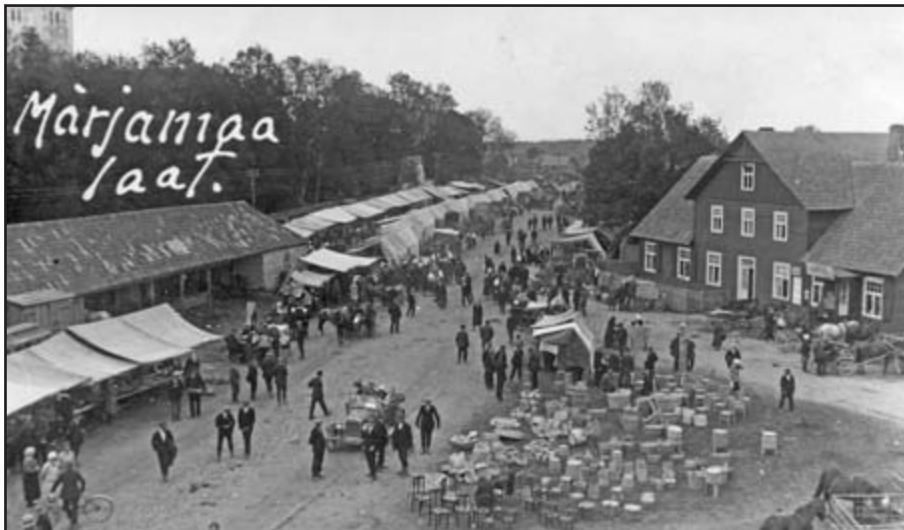
Märjamaa laat 1912-1913. aastal.