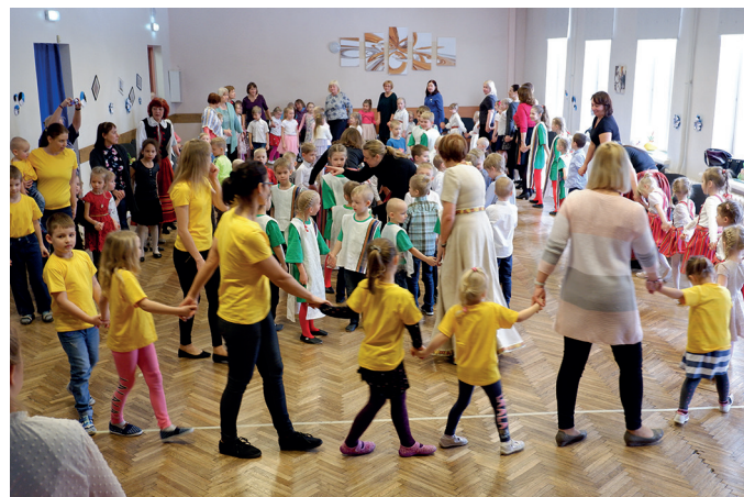
Valla lasteaedade tantsupäev Varbolas lõppes ühises tantsuringis.

Vastuvõtjad näitasid vahelapalana lühikesi Eesti-temalisi animatsioone, millest igäühel pikkust vaid mõned sekundid, kuid mille taga on