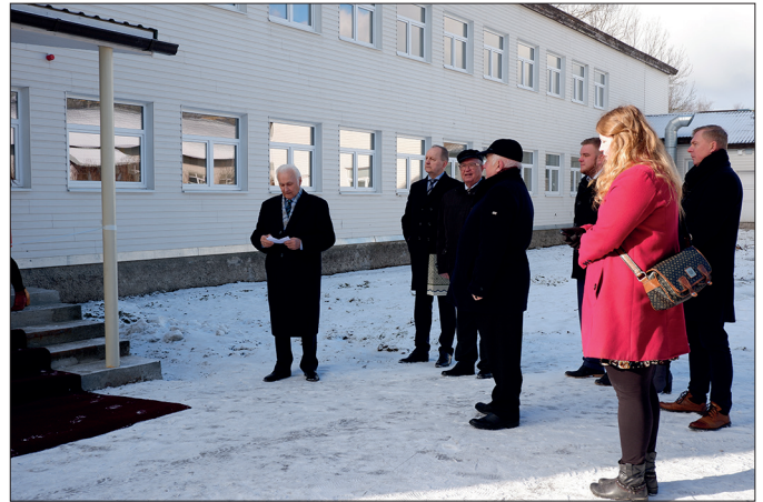
Koloveres asuva Lossipargi Eakatekodu avamisel kõneles president Arnold Rüütel.

Esimene kolmest majast on remonditud ja märtsi keskel kolivad sisse esimesed kliendid. Kogu kompleksi uuendamiseks investeeritakse 1,5 miljonit eurot ja siin saab olema 165 kohta.