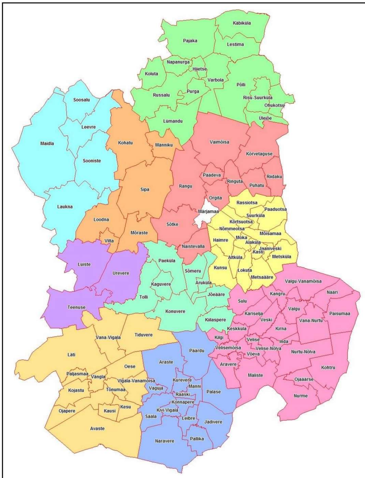
Joonis 2. Märjamaa valla piirkonnad