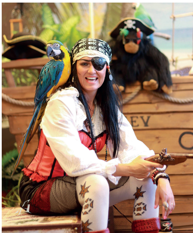
Papagoi Keskuse perenaine piraadina.