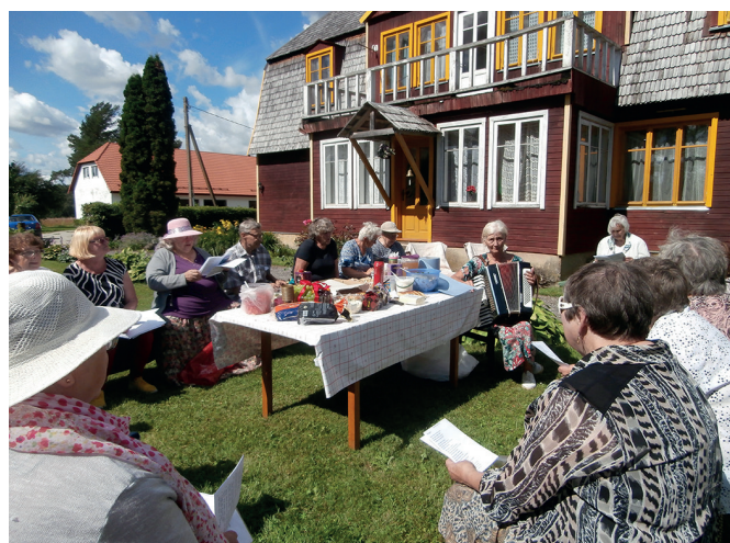
Lauluklubi Kukemari Mäe-Meeritse talus.