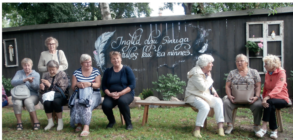
Inglite Kodu külastajaid võtab vastu hea soov.

Nii kokku saades tekkis plaan ka veidi laiemalt ringi vaadata, sest koos oma tuttava rahvaga on kõik kindlam ja