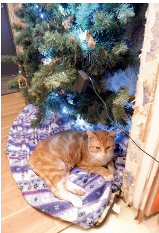
Heracles otsib suure südamega kodu, kes võtaks ta tervisehädadest hoolimata. Vastutasuks saab pere endale imearmsa iseloomuga tänuiliku sõbra.