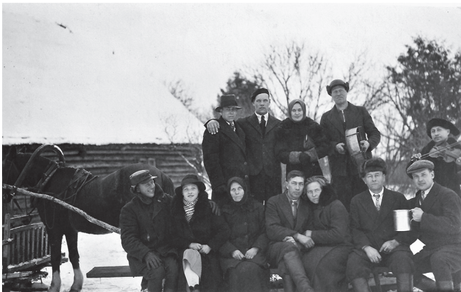
Vigala. Avaste. Maalinnas jõulupühade ajal. 1930. aastad.