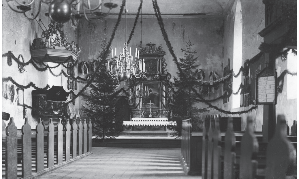
Jõuluaegne Vigala kiriku sisevaade. Arvatavalt 1920-ndatel aastatel.

Tänavu tulevad jõulud ja aastavahetus tavalisest vaashoitumalt, et kuri viirus kimbutama ei pääseks. Olgu seekordne vanade fotode valik siiski seotud pidustuste, tähistamiste ja meelelahutusega. Kuna talve moodsus ei ole, siis haakuvad eri aastaegadel tehtud jäädvustused teemaga samuti.