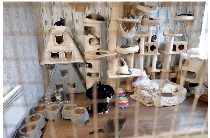
Vaade kassituppa läbi uksest oleva võre.

Augusti lõpus jõudsid minu hoole alla kolm satsi kassipoe, keda nimetasin H-pundiks, I-bandeks ning K-komandoks. Esimese kahega on tänaseks läbimurre saavutatud ning mõni neist on juba kojugi saanud. K-komando moodustasid aga kolm kanget öde – Karoliina, Karlota ning Katalena – ning pärit on nad Kivi-Vigalast.