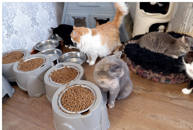
Turvakodu kassid mängutoas.