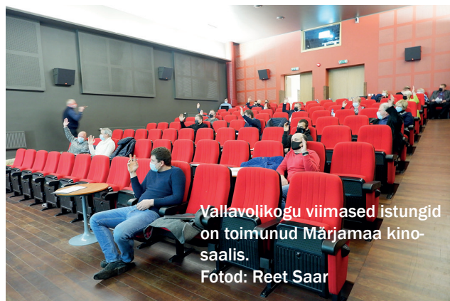
Vallavolikogu viimased istungid on toimunud Märjamaa kinossaalis.

Võeti vastu määrus „Erakoolide tegevuskuludes osalemine“. Sisuliselt on tegemist 2017. a augustist pärit määruse kehtivuse pikendamisega – Märjamaa vald osaleb teatud tingimustel erakoolide tegevuskulude katmises kuni 31. augustini 2021.