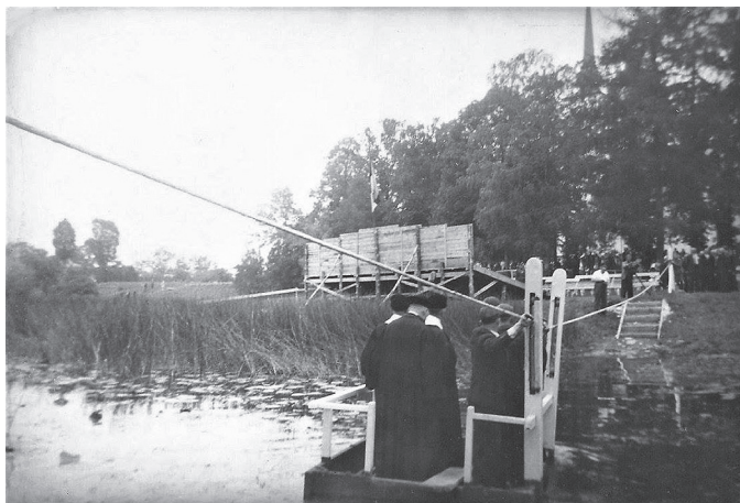
Arvatavalt Vigala koguduse 600. aasta juubeli (1939) puhul korraldatud laulupäeval võetud kaader. Kirikutegelased liikumas lodjaga pastoraadist kirikuaeda.