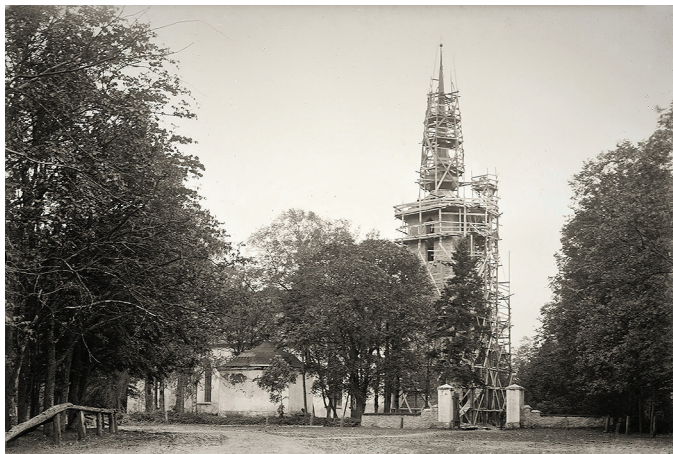
Kivi-Vigala. Vigala kiriku torni ehitamine. Aasta on 1932.