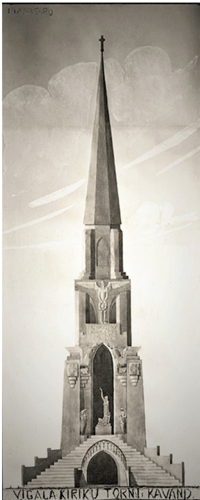
Vigala kiriku torni kavand.

(Kirikutorn-mälestussammas avati Vigalas. Postimees, 2.08.1933.)