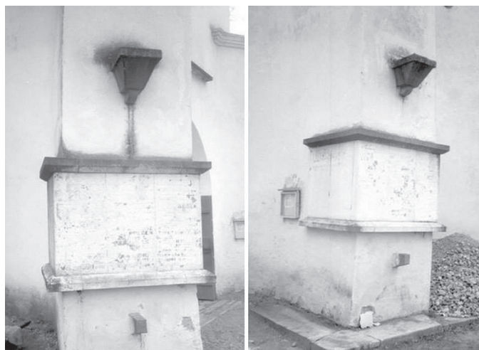
Vigala kiriku kinnikaetud mälestustahvlid nõukogude ajal.

1948. aastal lubatakse üle tahvlid Esimeses maailmasõjas ja Vabadussõjas langenute nimedega ja kaetakse plekk-kattega kinni kiriku seinal olev vabaduserist. 1950. aasta sügisel võetakse maha ka torni küljes olevad graniidist Vigala talupoja ja sõduri kuju ja maetakse need kirikuaeda.