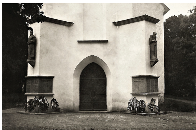
Wigala kiriku tornmonument sõdades langenud Wigala meestele. 1930. aastad.

13. oktoobril 1950 teatati kujude kõrvaldamisest.