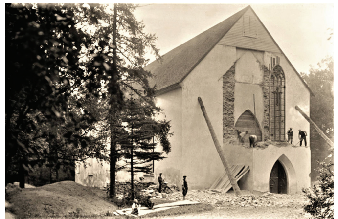
Kivi-Vigala. Vigala kiriku torni ehitusele eelnenud lammutustööd. 1930. aastate algus.