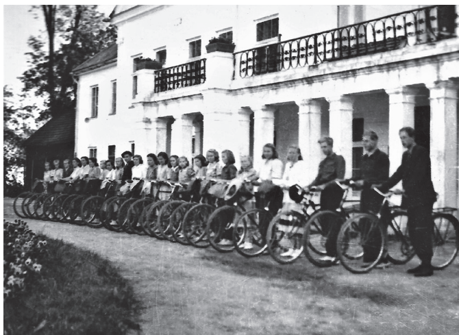
Vigala Aianduskooli õpilased enne jalgrattamatka algust 1952. aastal.