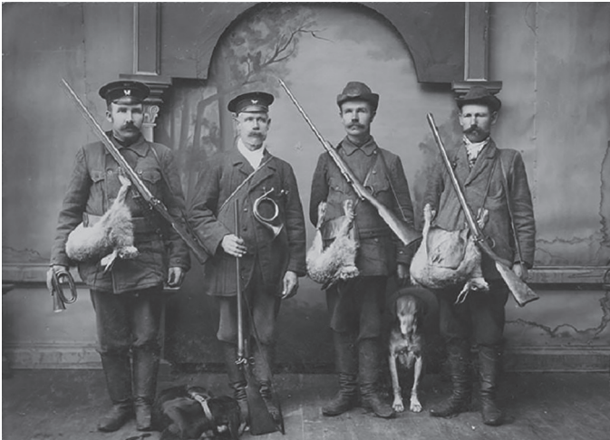
Vigala paruni jahimehed 1910. aastal.