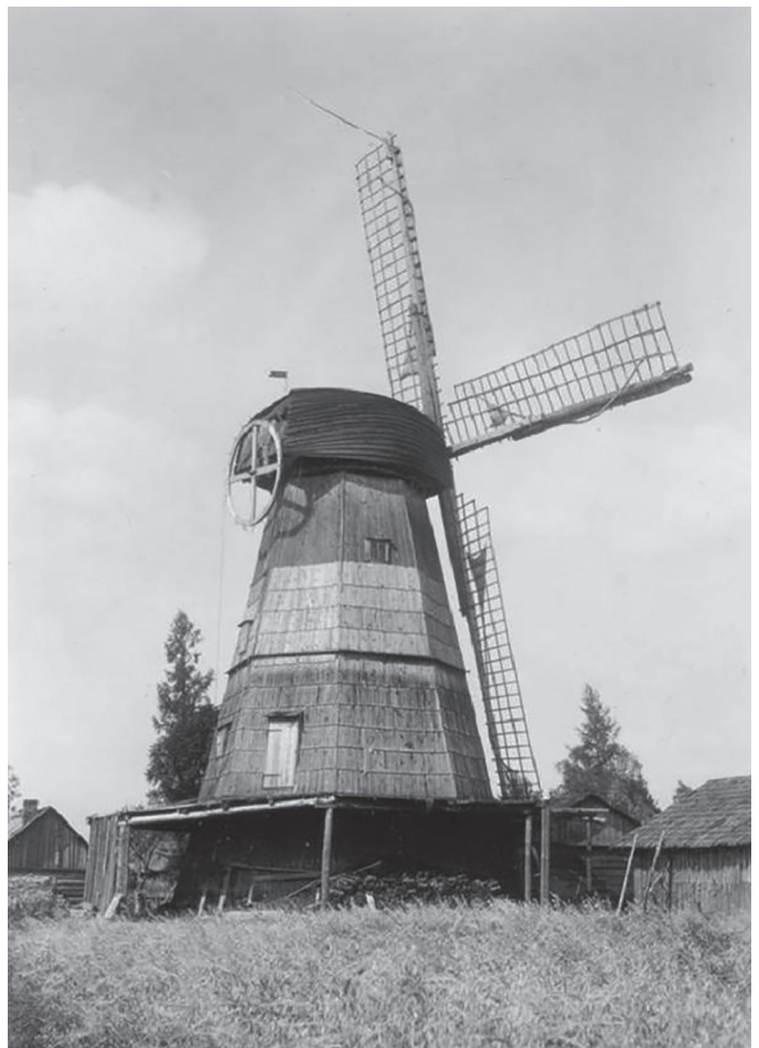
Noorekle veski Kurevere külas.