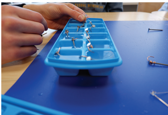
Patareid töötab!

vad edaspidi lahendada ka teised õpilased.