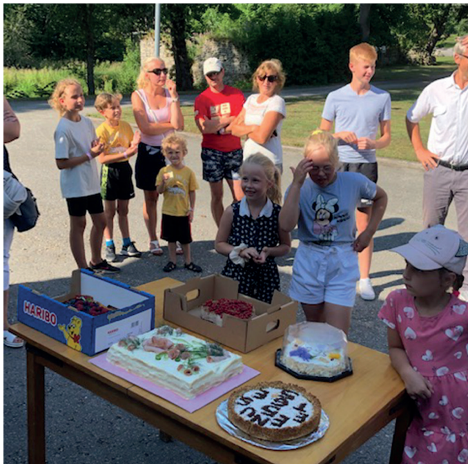
Koogioksjoni teemaks oli Teenuse küla vanusele viitav 565.