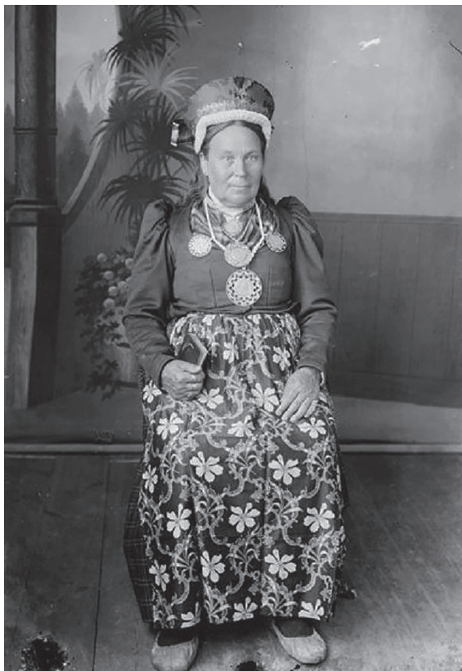
Vigala ämmaemand rahvarõivais.

Tähtsad tööorganid bageril ongi pikad jalad ehk toed. Need surutakse jõepõhja ja seega on ujuk fikseeritud. Fikseeritud jõekaevaja on hoopis tootlikum.