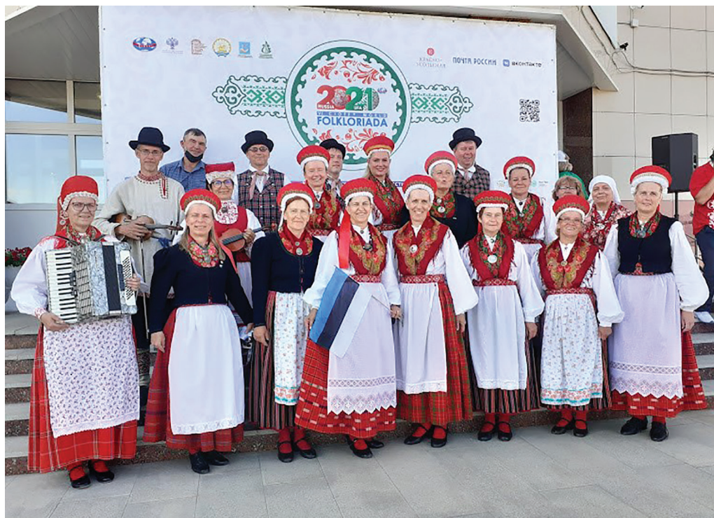
Kiitsharakad koos muusikutega.