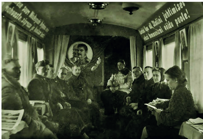
Valimiste agitvagun Virtsu raudteel.