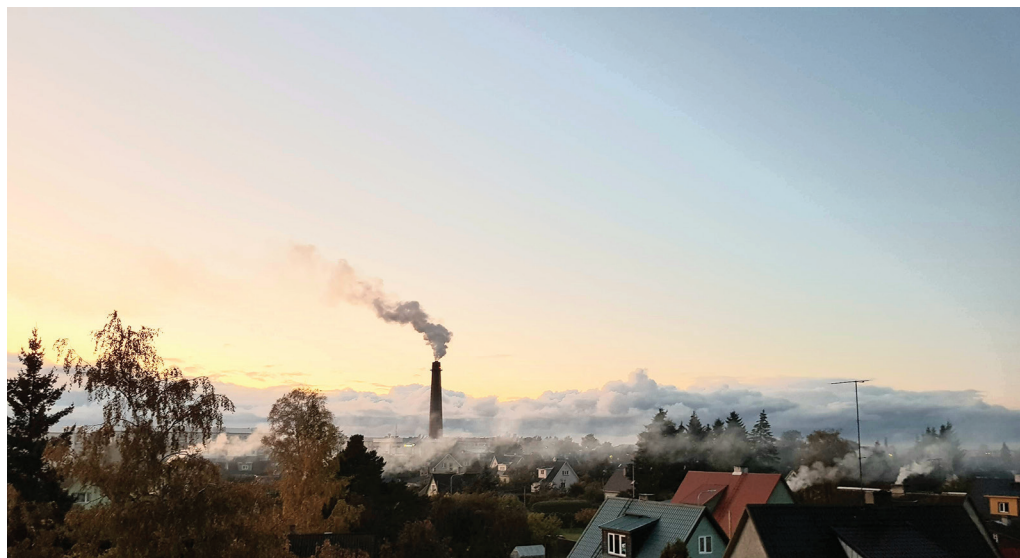
Kütteperiood toob kaasa korstnaist tõusvad suitsusambad

Dioksiinid on silmale nähtamatud ja nende mõju inimese tervisele ei avaldu kohe. Võib minna aastaid, enne kui haigusnähud ilmnevad. Peale välisõhu jõuavad saasteained ka siseõhku, suuremas kogu-