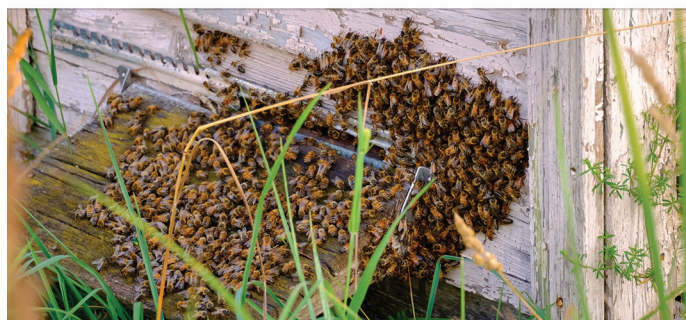
Sirli Tilga elus on koos mesindus ja sotsiaaltöö.