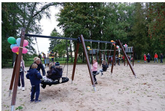
2021. aastal sai kaasava eelarve toel valmis laste mänguväljak Kastis külas.