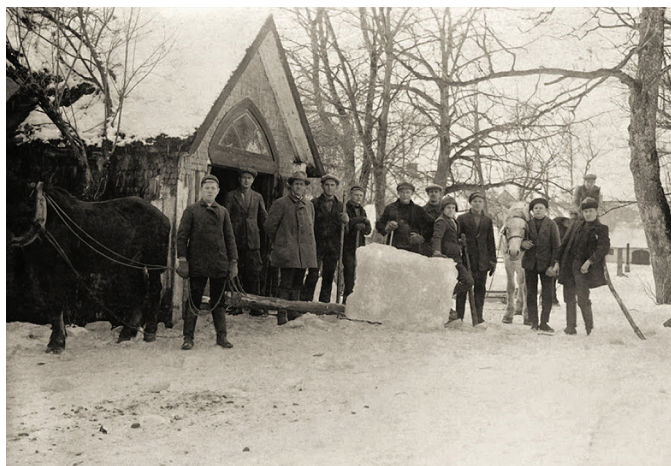
Vana-Vigala. Vigala Põllutöökooli õpilased 1925. aasta talvel koolitalule jääd vedamas.