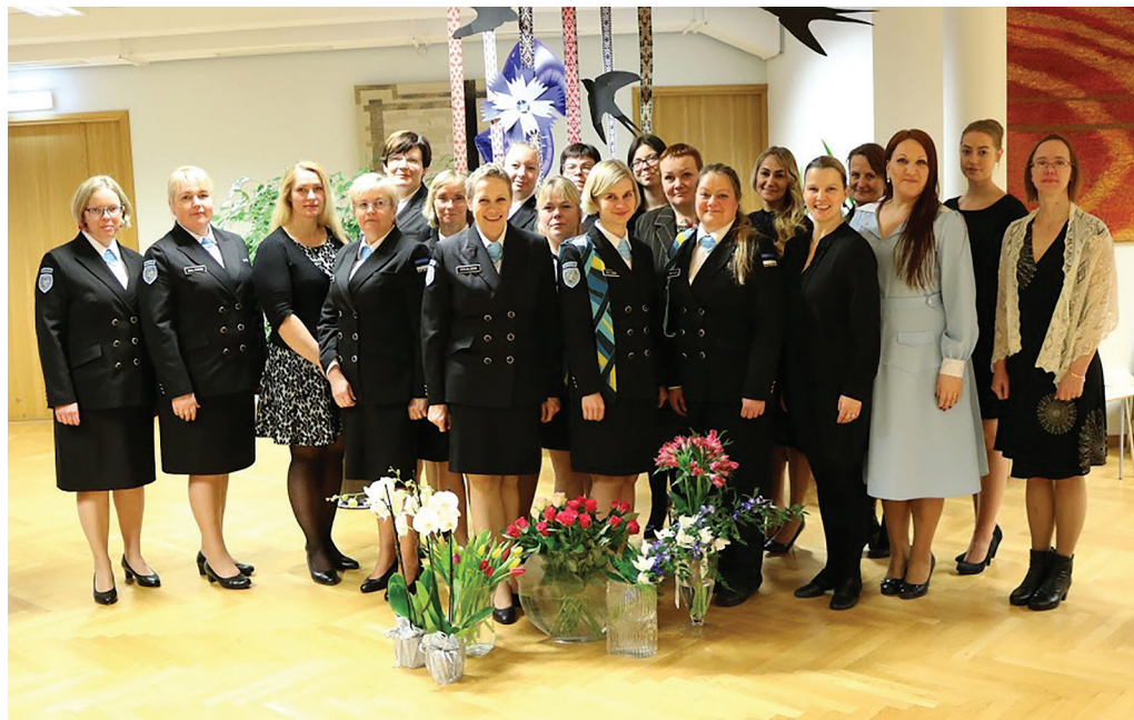
Naiskodukaitsse Märjamaa jaoskonna viies sünnipäev.

Kui riigikaitse juurde tagasi tulla, siis mitmed jaoskonna