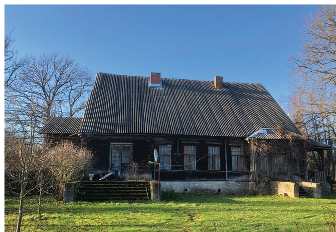
Tolli mõisa peahoone säilinud hoone osa, pildistatud 2021. aasta hilissügisel.