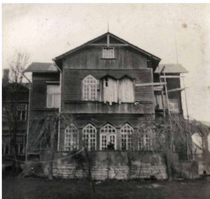
Tolli mõisa peahoone u 1930.