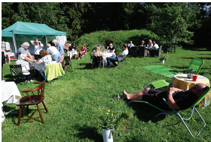
Naiskodukaitsjate kohvik Märjamaa Folgi ajal 2021. aastal.