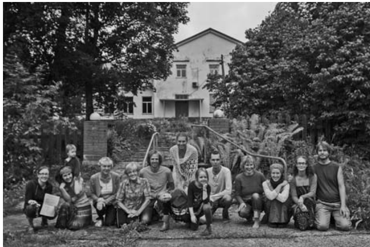
Rõõmsad ökokogukonna liikmed hoone üleandmise järel. Alumisel pildil vaade Mõisamaa mõisa lillerikkale hoovile.