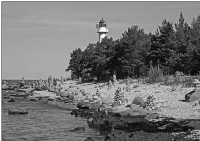
Vaade Vormsi rannale, kus nagu paljudes kohtades on külastajad hakanud laduma kivist tornikesi.

Suure muutuse saare ajaloos tõi kaasa Teine maailmasõda. Palju elanikke põgenes Rootsi, asemele tulid sõjapõgenikud Ees-